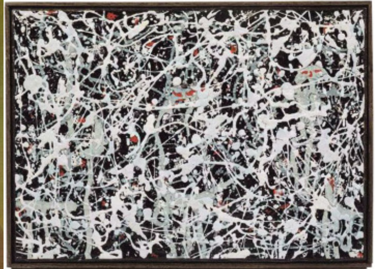
Jackson Pollock 1912-1956