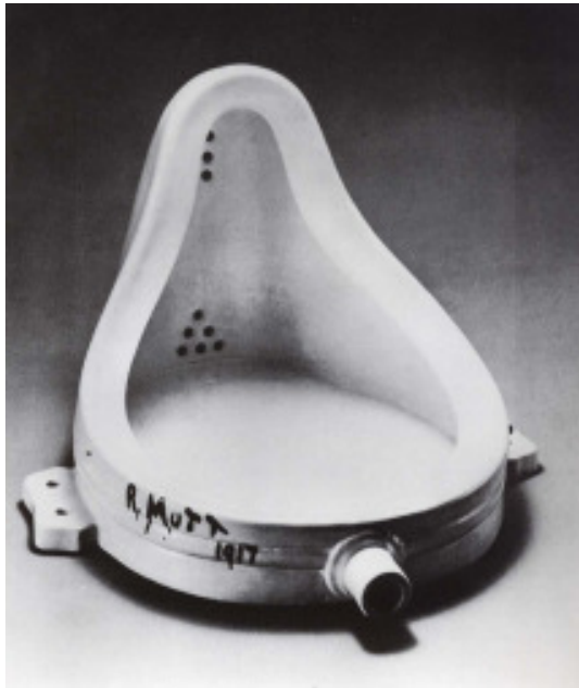
Marcel Duchamp 1916