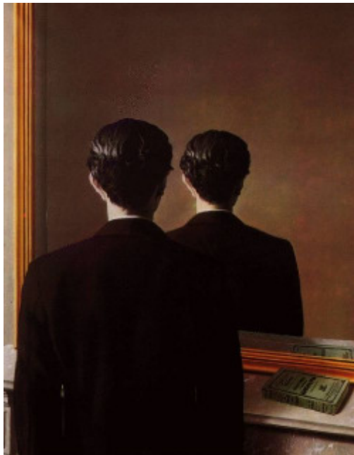
René Magritte 1937