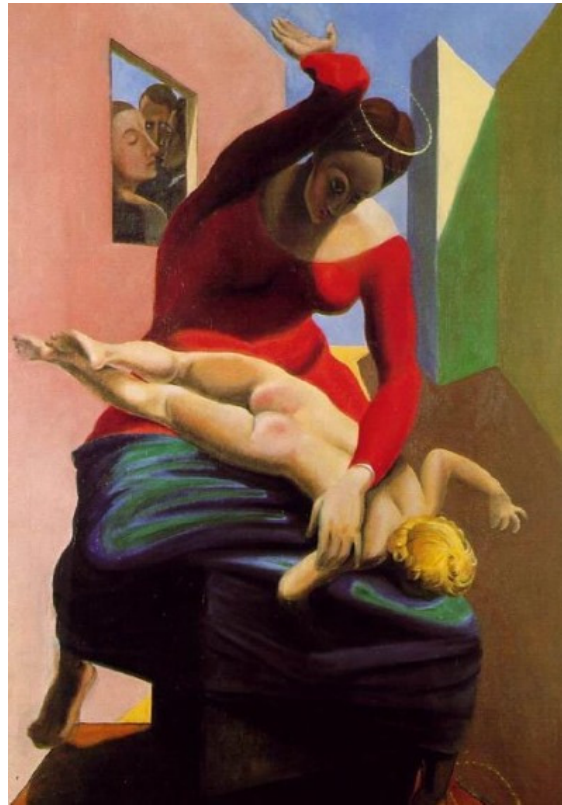
Max Ernst 1926